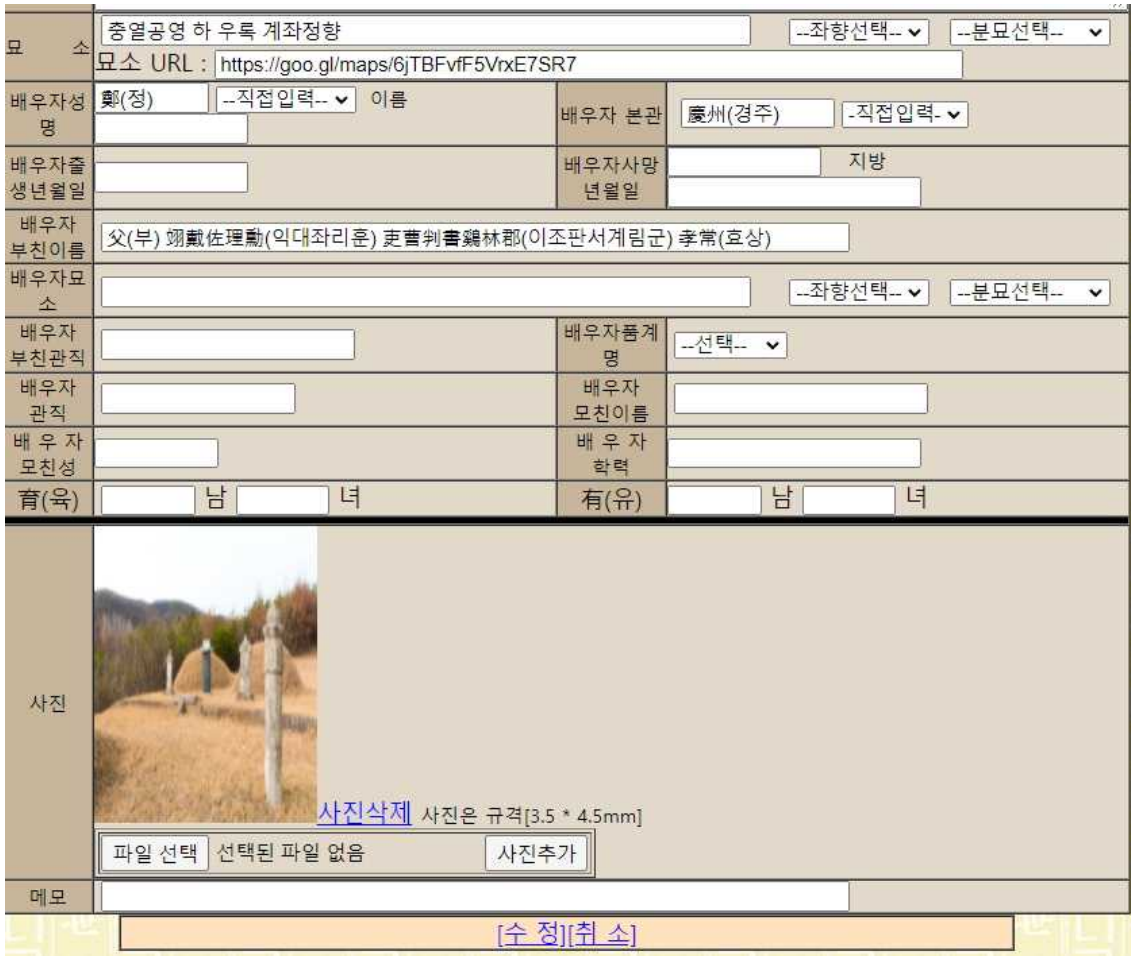
사진 등록은 '족보 등록, 족보 수정'에서 첨부할 수 있음